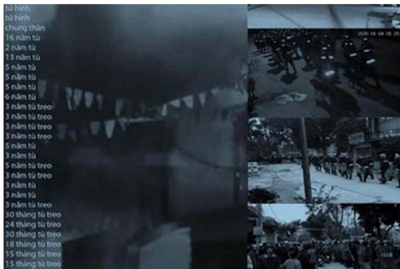
Các bản án tù dành cho 29 người dân Đồng Tâm, được tuyên trong phiên tòa sơ thẩm ngày 14/9/2020.

Tôi nghĩ ít nhất đã có một cuộc diễn tập từ trước. Vào ngày 2/1, một người dân ở làng Đồng Tâm đã quay được một video clip diễn tập của công an giống y như buổi tấn công vào làng Đồng Tâm. Người quay clip đã gửi clip đó cho người dân làng Đồng Tâm. Sau đó, anh này cũng đã bị bắt. Trong cáo trạng có nêu chuyện đó. Clip này đã được gửi từ ngày 2/1, có nghĩa là công an đã tập dượt từ trước. Ngoài ra, còn rất nhiều các điểm khác cho thấy đã có sự chuẩn bị trước đó. Ví dụ như trên phương diện truyền thông chẳng hạn, họ đã hạn chế nội dung của một số facebooker nổi tiếng như Bùi Văn Thuận bị báo cáo hạn chế nội dung vào đúng ngày 8/1, trước khi xảy ra tấn công một ngày. Những facebooker khác thường hay nhận những lời kêu cứu từ dân làng Đồng Tâm như Phan Văn Bách, ở Hà Nội hay Bùi Thị Minh Hằng, ở Vũng Tàu cũng đều bị khóa facebook ngay trước giờ họ tấn công. Thật ra từ lúc buổi tối thì không khí đã rất căng thẳng, đã có rất nhiều tín hiệu SOS từ trong làng Đồng Tâm báo ra và tiếp theo là các trang web của làng Đồng Tâm đều bị đánh sập. Và, từ 3 giờ sáng đã có một làn sóng dư luận viên trên mạng chửi bới bà con Đồng Tâm rồi. Nếu không phải dư luận viên hay những người có nhiệm vụ thì chẳng ai thức từ 3 giờ sáng cả. Tức là đã có sự chuẩn bị từ trước rất kỹ càng.