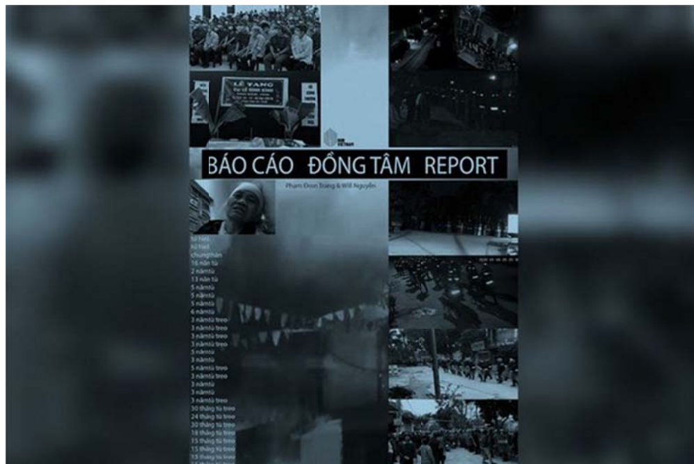
Báo cáo Đờng Tâm, ấn bản thứ 3 bằng song ngữ Anh-Việt là bản đầy đủ nhất trong 3 bản được phổ biến trong năm 2020. -RFA Edited