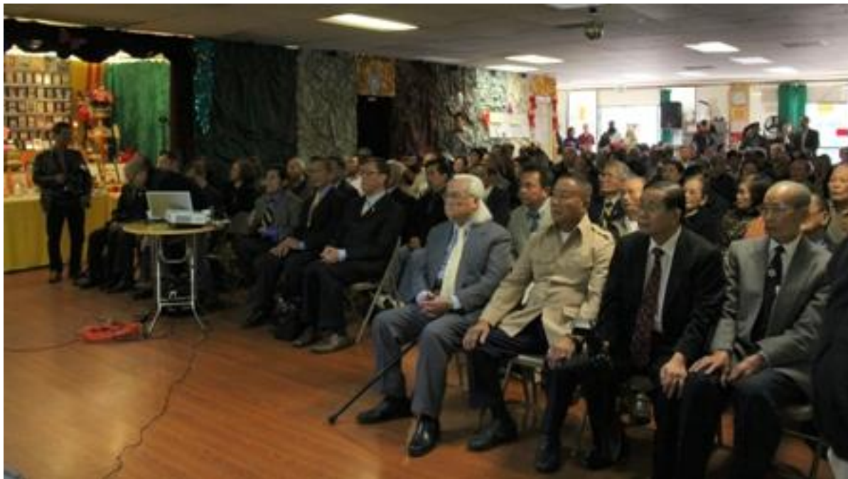
Quan khách tham dự