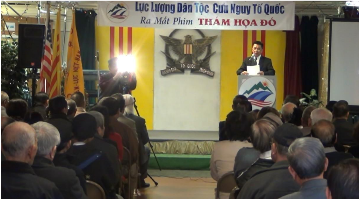
Quang cảnh Hội Trường