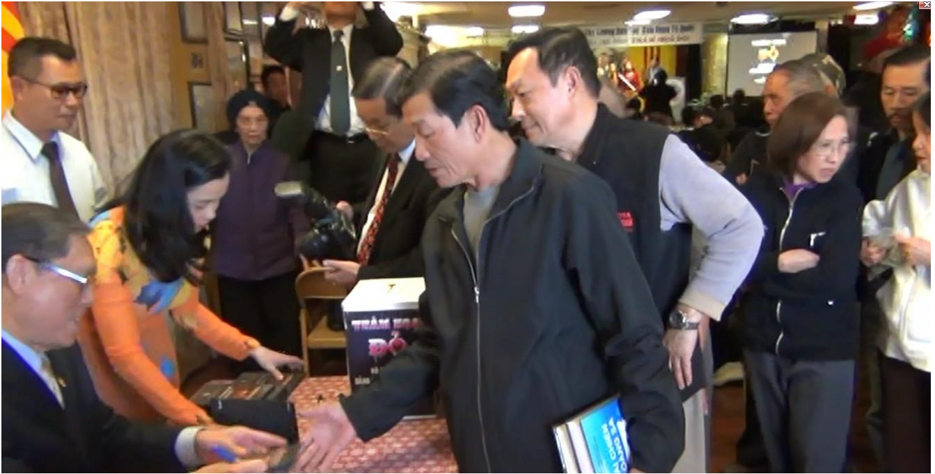
Ký tặng DVD