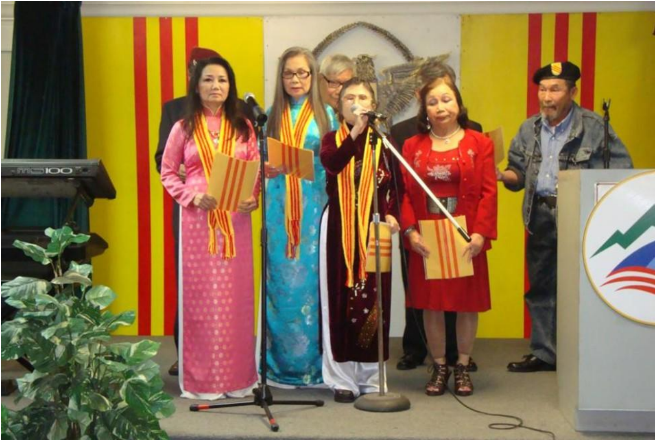
Ban Văn nghệ Khu Hội Cựu Tù Nhân Chính Trị Bắc Cali