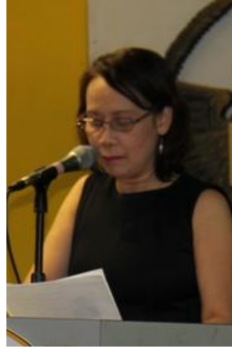
MC Hạ Vân